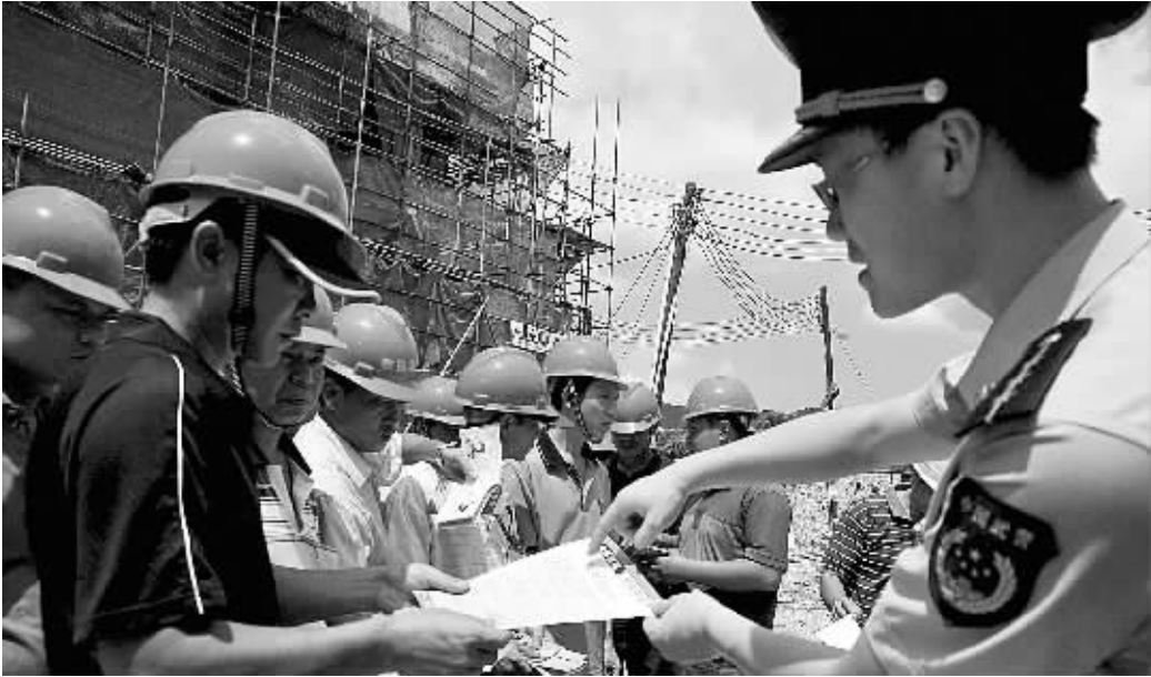
下图 6月20日,广东中山边防支队禁毒宣传组走进工地,为农民工宣讲禁毒的有关知识。李松林摄