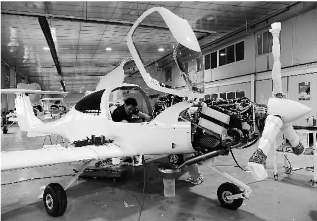
6月21日,山东滨奥飞机制造有限公司工作人员在航电车间装配钻石系列轻型飞机。该公司是中国CAAC认证的整机制造商,并获得欧洲航空安全局(EASA)认证,已生产钻石系列轻型飞机整机96架,累计签订购机合同235架。

此外,记者从中国铁路总公司获悉,7月10日至8月31日,京广、京沪高铁部分动车组列车的商务、特等和一等座票价按不同时段实行特惠。特惠幅度将在预售期1至5天内实行8.5折特惠,在预售期6至20天内实行8折特惠。同时,6月23日起至9月10日前的学生票预售期延长至30天,12306网站、电话订票、车站窗口、代售点同步发售。