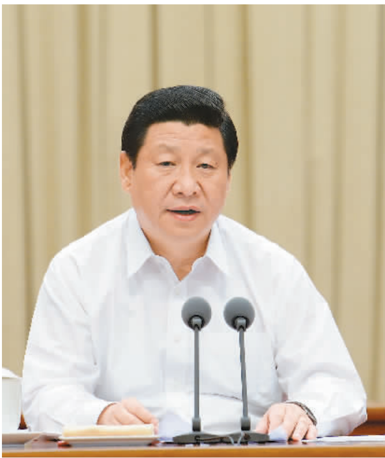
6月18日,中共中央总书记、国家主席、中央军委主席习近平在党的群众路线教育实践活动工作会议上发表重要讲话。

习近平强调,这次教育实践活动的主要任务聚焦到作风建设上,集中解决形式主义、官僚主义、享乐主义和奢靡之风这“四风”问题。这“四风”