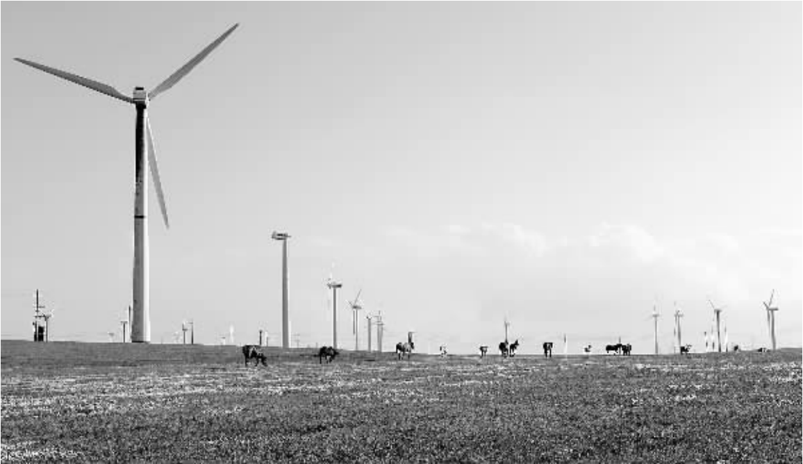
这是内蒙古乌兰察布察右中旗辉腾锡勒草原上的风电场。自1996年起风电场累计发电近100亿千瓦时，减少二氧化碳排放1000多万吨。

央行数据显示，5月份社会融资总额增加1.19万亿元，显著低于4月份的1.747万亿元。“社会融资规模有所减少，主要是因为有关部门对此前迅猛发展的综合信贷加大了监管力度。”摩根大通中国首席经济学家朱海斌表示，在银监会出台了收紧银行理财产品的相关措施后，5月份信托贷款环比少增近千亿元。