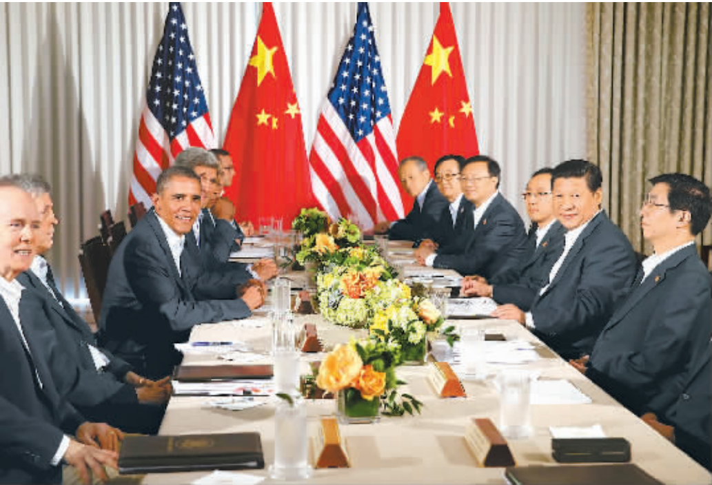
6月8日,国家主席习近平在美国加利福尼亚州安纳伯格庄园同美国总统奥巴马举行中美元首第二场会晤。