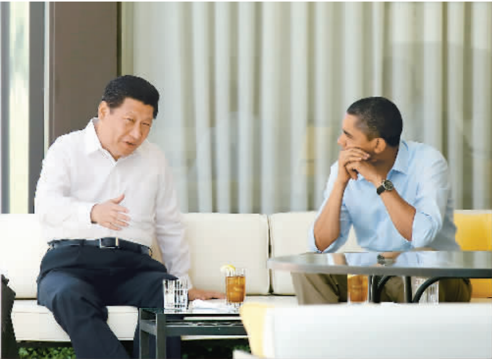
6月8日,国家主席习近平在美国加利福尼亚州安纳伯格庄园同美国总统奥巴马举行中美元首第二场会晤。这是会晤开始前,习近平和奥巴马在庄园散步途中茶歇交流。