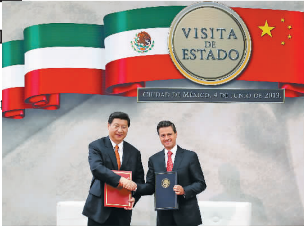
6月4日,国家主席习近平在墨西哥城同墨西哥总统培尼亚举行会谈。这是会谈后,两国领导人共同签署《中华人民共和国和墨西哥合众国联合声明》。