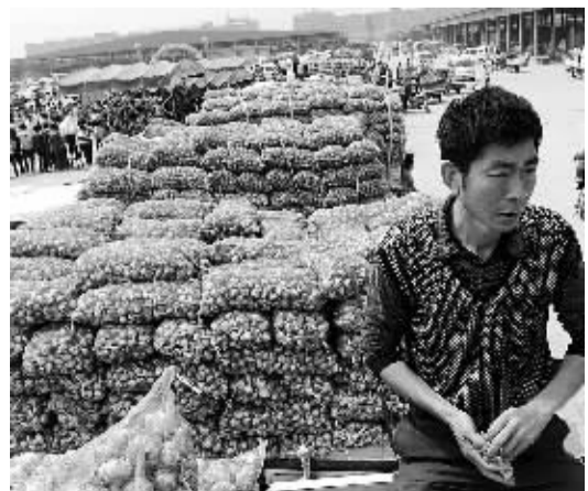
5月28日,在河南省中牟县的一个农产品交易市场,大蒜商贩在车上观望。