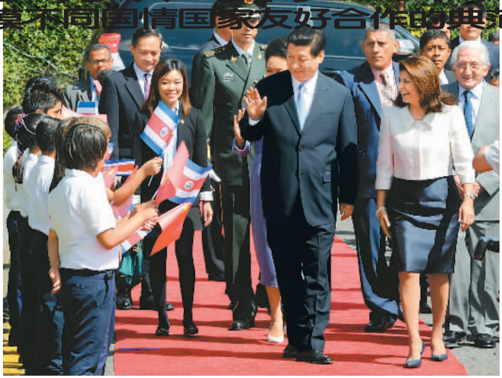
6月3日,哥斯达黎加总统钦奇利亚在总统府举行仪式,热烈欢迎国家主席习近平对哥斯达黎加进行国事访问。这是习近平主席在钦奇利亚总统陪同下向参加欢迎仪式的哥斯达黎加儿童挥手致意。