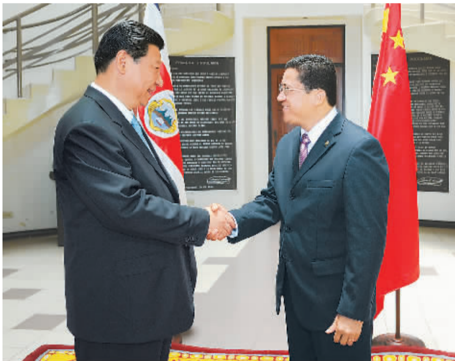
6月3日,国家主席习近平在圣何塞会见哥斯达黎加立法大会主席门多萨及各政党代表。