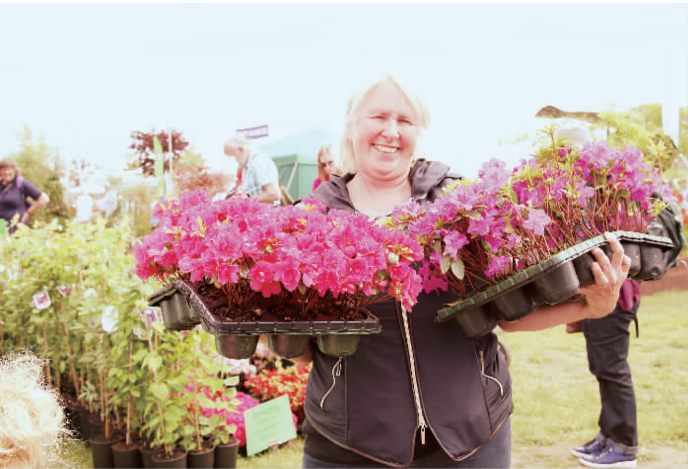
为期3天的第14届苏格兰园艺展销会日前开幕,400多家参展单位用种类繁多的植物、蔬菜和鲜花布展,推介园艺活动,倡导自然健康的生活方式。图为一名女士展示盆栽鲜花。

正是由于经济复苏势头强劲、旅游市场潜力诱人、投资环境不断改善,印尼旅游领域的国内外投资也逐年增长,2012年,旅游业投资金额共计8.698亿美元,其中外资有7.863亿美元,同比增长210.86%。为此,印尼政府在政策优惠、投资利益保护、合作方式多样化等方面继续鼓励支持,以期吸引更多的国内外投资。