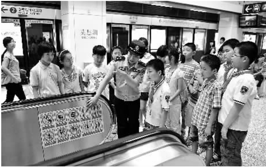
上图 江苏南京地铁公安民警向小学生讲解搭乘地铁的安全小常识。