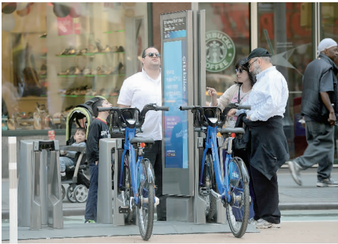
5月27日,市民在纽约市曼哈顿区一处自行车服务站点查看可租用的自行车。

当地分析师认为,人民币债券的发行将为许多新加坡本地的财富管理提供新的投资渠道,同时也有助于亚洲快速增长的人民币计价贸易活动。