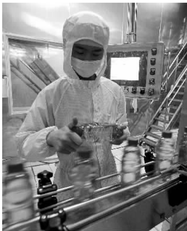
达能工厂流水线工人。

秦鹏谈到中国达能在2013年的发展战略时强调说:“从总体上看,达能在中国的发展非常令人满意,未来我们将继续在中国市场成功的战略,并不断加大对中国市场的投资。达能对中国市场的承诺是长期的,我们对未来充满信心。”