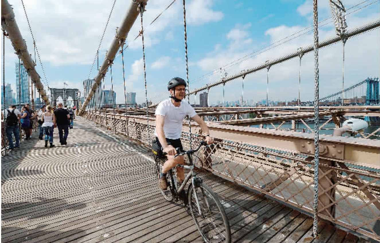
5月20日,游客在美国纽约布鲁克林大桥上游览。纽约布鲁克林大桥横跨纽约东河,连接曼哈顿区与布鲁克林区,除了为本地交通发挥重要作用之外,也是深受游客喜爱的著名景点。布鲁克林大桥于1883年5月24日建成开放。

势生产目前需求量上升的海洋挖掘船和油气传输设备。业内人士分析,未来挖掘船及海上油气传输设备和船舶的市场前景非常可观,今后5年的订单量可达2000亿美元,日本造船业必须以自己独有的先进技术抢占这个市场。