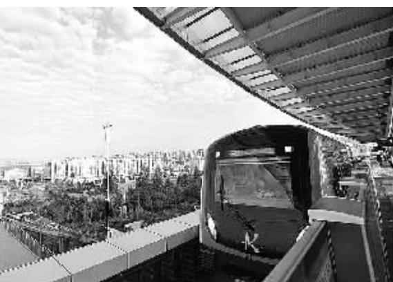
5月20日,一列地铁列车准备进站。当日,昆明地铁1、2号线首期工程进行载客试运营,这也是国内开通的首条高原地铁。