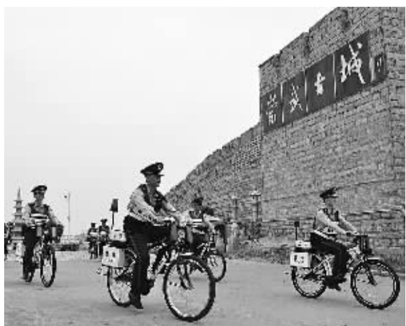
骑着自行车，穿过古道小巷……近日，福建省泉州市崇武边防派出所所在千年古城崇武风景区，启动了“网格化自行车警务巡逻”。

云南省澜沧县位于普洱、临沧、西双版纳3个边境州市交界处，且直接与缅甸掸邦第二特区接壤，地理位置特殊，毒情形势复杂。针对毒情实际，澜沧边防大队依托各种专项行动，采取“一线堵二线查”、“声东击西、避实就虚”等技战法，不断加大禁毒防艾宣传和吸毒人员收戒力度，编织起一张从打击制贩毒到禁吸戒吸的禁毒“天网”，取得了突出战果。（庄科 皮泽瑜）