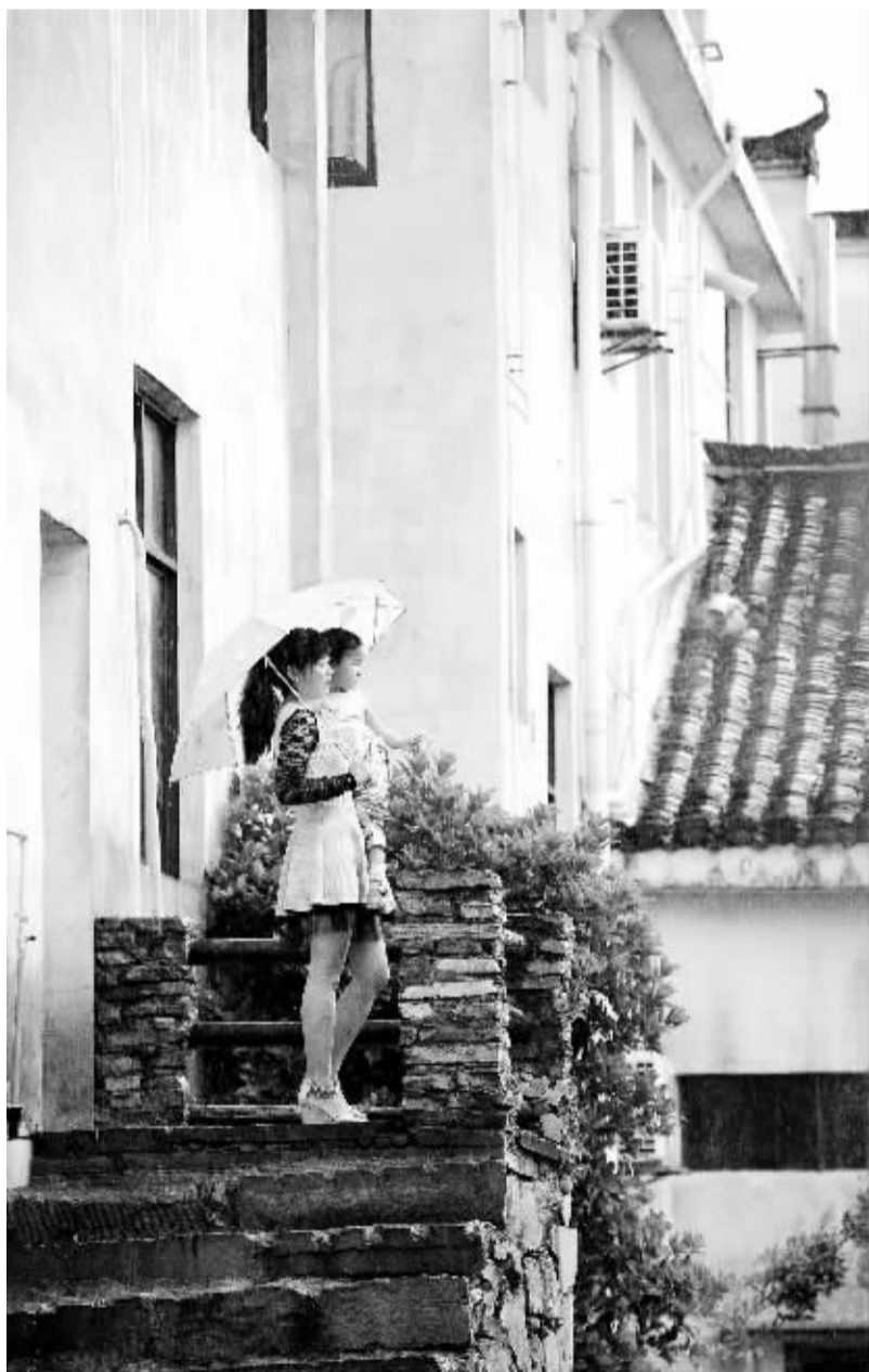
△ 德阳市罗江县凤雏村经灾后重建,每户村民都住上了二层小楼,家家办起乡村旅游,人均纯收入1.8万元。