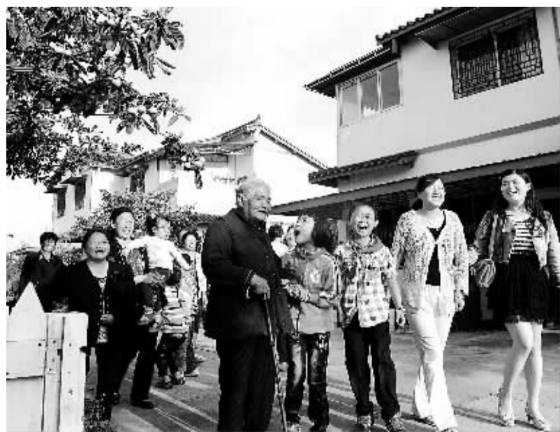
△ 什邡市元石镇箭台村的村民相约到村中心广场,准备跳健身娱乐的“坝坝舞”。