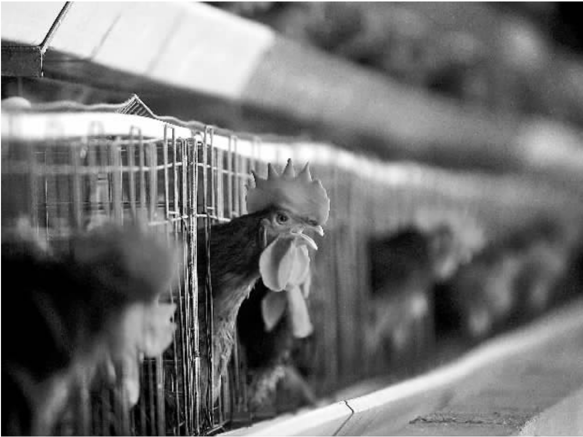
隆安凤翔家禽有限责任公司丁当鸡育种中心的鸡舍(4月25日摄)。

海南省海洋与渔业厅负责人介绍,海南管辖的西沙、中沙和南沙渔业资源丰富,是我国最大的天然渔场。儋州市采取“公司+渔民”的方式进行渔业生产,提升了三沙海域渔业生产的组织化、规模化、集约化程度,提高了渔业生产效益,为海南进一步在三沙海域合理开发渔业资源创造了良好条件。