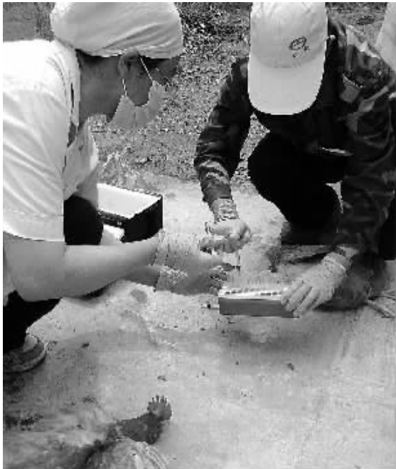
北京市平谷区动物卫生监督局东高村所防疫员(右)在北京文作兴养殖有限公司采集活鸡血样。