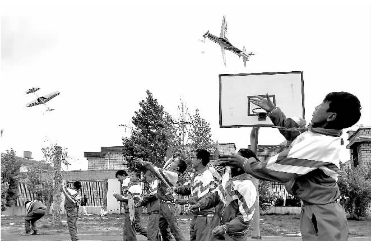
5月9日,拉萨市藏热小学的学生在操场上放飞用套件制作的航模。当日,2013放飞梦想——波音航空科普教育系列活动在拉萨启动。该活动自2012年起进入西藏,是一项融航空科普知识、动手操作实践、科技专题考察为一体的公益性科技实践活动,也是首个在西藏地区开展的航空科普教育项目,目前已有1000多名学生在活动中受益。

沙尘天气包括扬沙、浮尘、沙尘暴三类。原预警信号只对沙尘暴级别的严重沙尘天气发布黄、橙、红三色预警。经多年治理,北京地区出现沙尘暴几率已非常小,但扬沙、浮尘对生产、生活影响较大。修订新增沙尘蓝色预警,标准为12小时内可能出现扬沙或浮尘天气,或者已经出现扬沙或浮尘天气并可能持续。