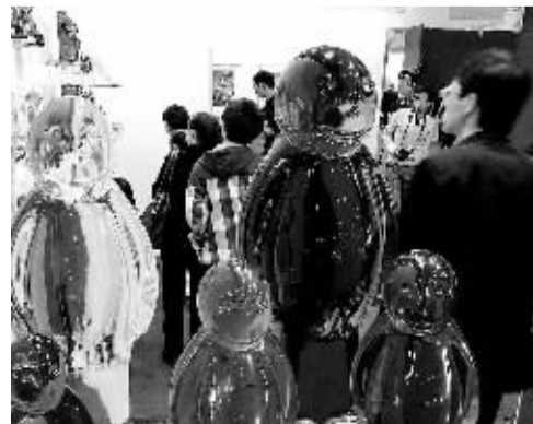
5月1日，观众在参观博览会上的现代雕塑作品。当日，2013艺术北京博览会在北京全国农业展览馆开幕。

产业的发展离不开企业的支撑。对于企业，高新区主要是搭建平台。一方面搭建政策平台，鼓励企业进行国际科技合作，安排国际科技合作专项资金，建设国际合作基地等；另一方面是搭建孵化器，帮助高新区企业寻找最新科技成果并迅速实现产业化。