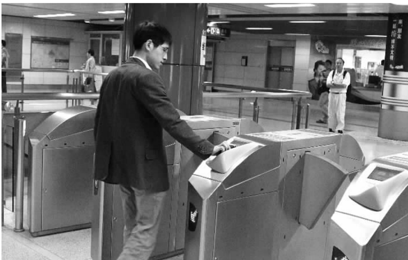
随着智能手机的普及，它正成为大部分人获取信息的主要来源，同时也使生活更便捷、高效。