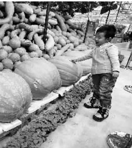
右图:在北京昌平区举办的“农业嘉年华”上,有 300 家国内外企业参展,700 多种优质农产品展销。人们可以在现场进行 400 多种农业种植体验、30 项农业创意体验,还可以品尝到 60 多家企业带来的中华传统特色美食。此次活动将持续到 5 月 12 日。