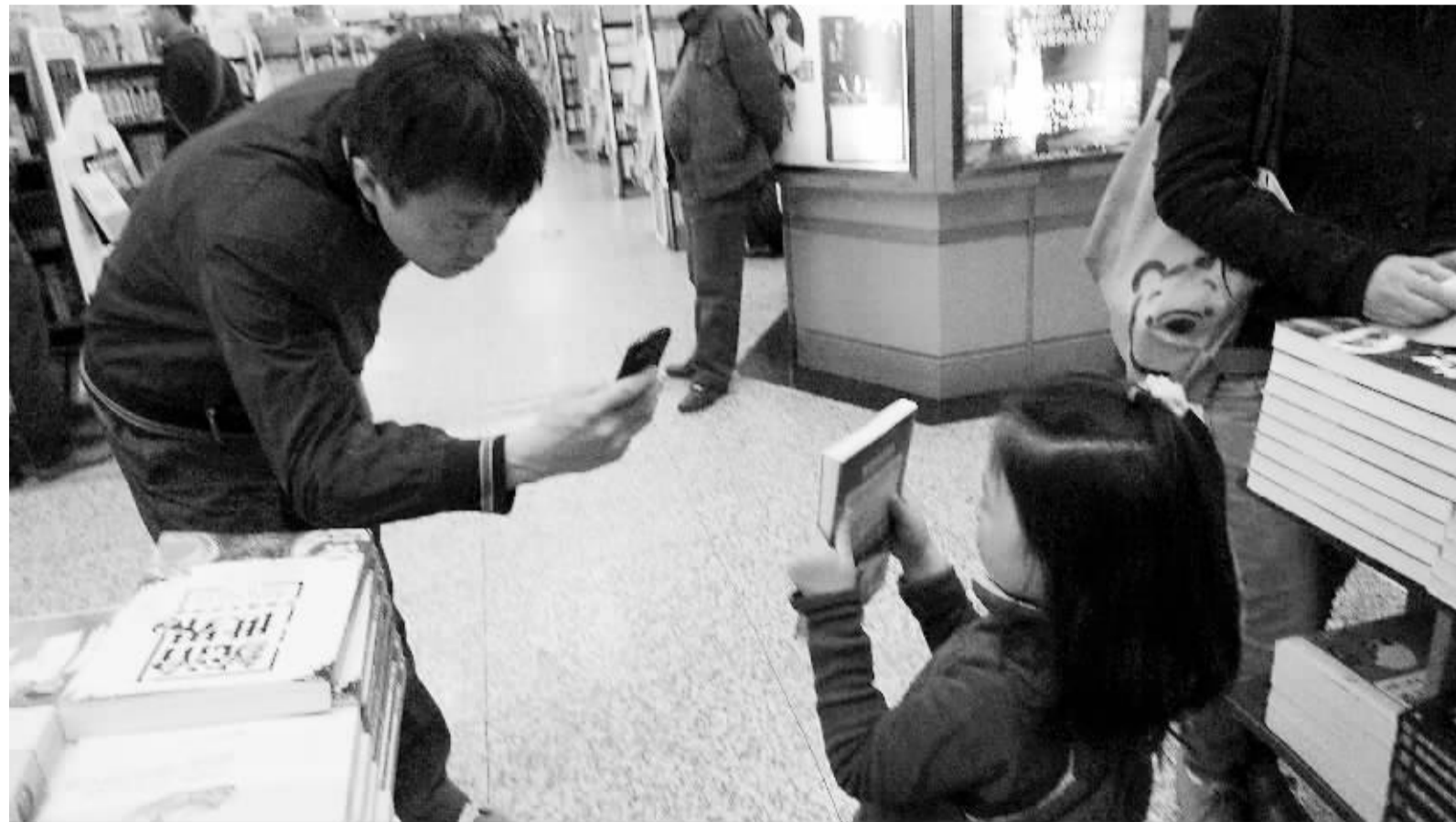
移动入口的争夺之战,已经延伸至产业链源头。从近日启动的2013年盘古搜索杯移动搜索创新大赛上获悉,大赛开辟的“行动派”即是为未来争夺移动搜索创新产品而设计的一个版块。