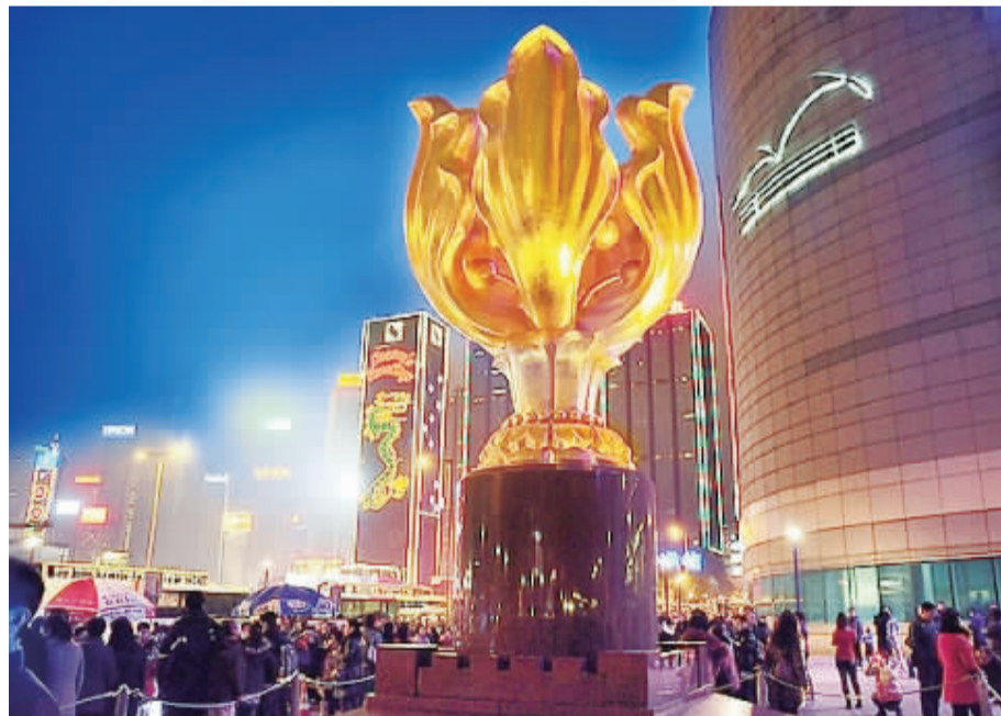
香港金紫荆广场夜景。

第一届论坛提出培育两岸及香港产业新亮点,共同打造中华民族自主品牌;加强两岸及香港金融监管合作,开发更多金融产品;借鉴台湾与香港经验,扶持中小企业发