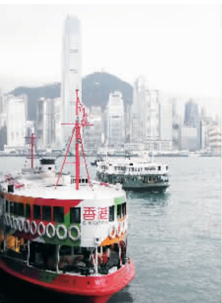
香港维多利亚湾景色。

10年来,1个主体协议,9个补充协议,CEPA将内地与香港紧密联系在一起。2004年1月1日,CEPA主体协议正式实