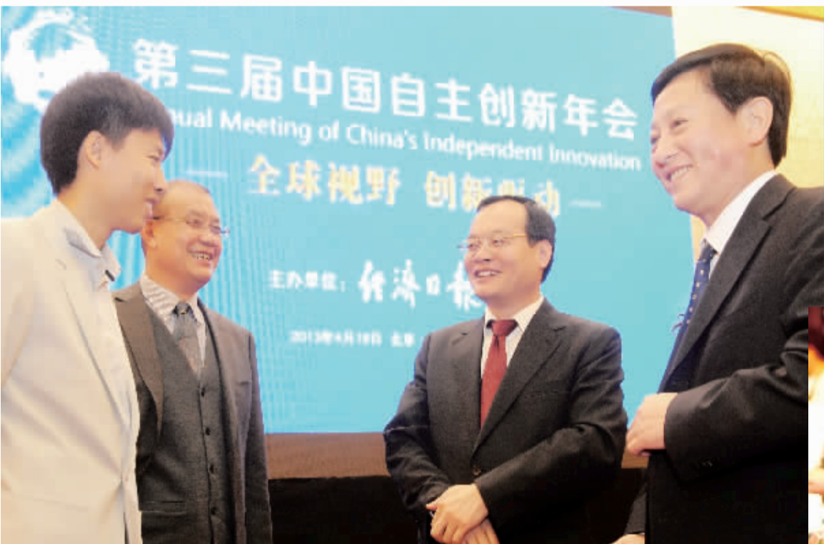
左图 4月18日，第三届中国自主创新年会在北京人民大会堂举行，参会嘉宾热烈交流。