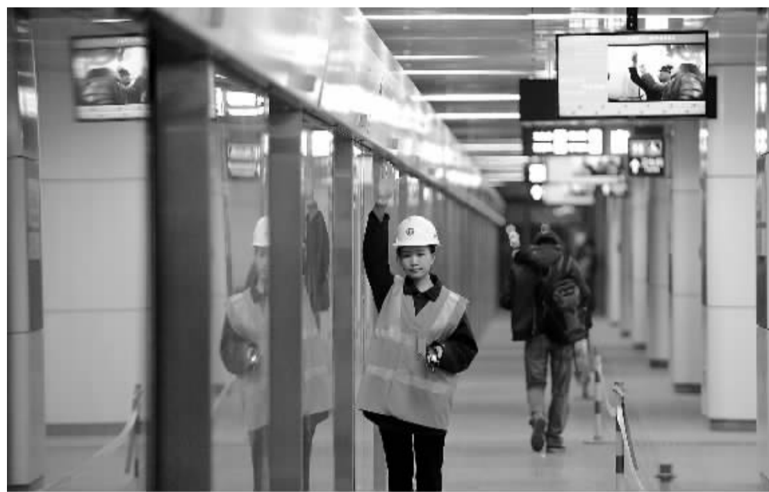
4月18日,北京地铁14号线郭庄子站,工作人员正在调试检查。当日,北京地铁14号线西段部分车站亮相,将于5月上旬开通试运营。