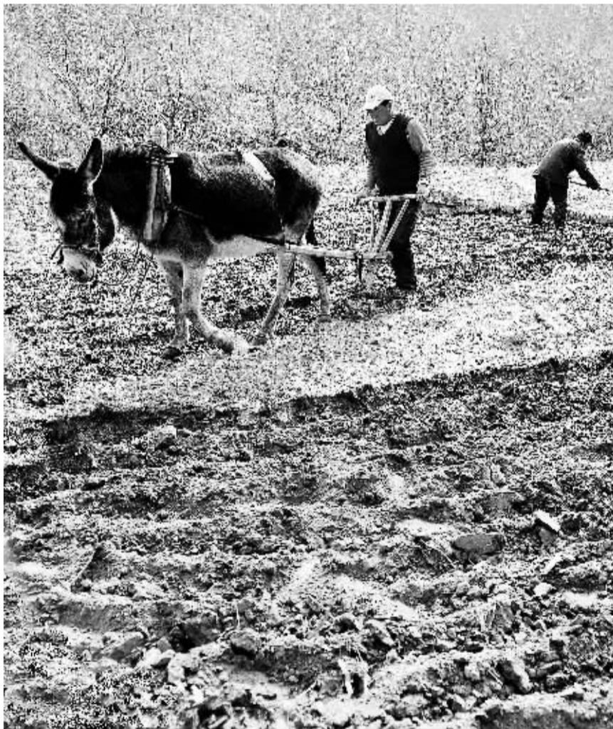
4月15日,河北狼牙山脚下的七峪乡武家庄村农民正在犁地。随着北方气温回暖,农民抓住有利时机忙春耕。

入社经营分“股金”。大力发展组建专业合作社,吸纳缺乏蔬菜种植技术、资金的种植户以土地入股方式参与到合作社,进行设施蔬菜和裸地蔬菜种植,通过股金分红增加收入。合作社按照市场需求与种植户社员签订产销合同,提供产前、产中、产后的技术、信息、销售等全程服务,在种植户与市场之间架起桥梁,有效地解决农民一家一户种植技术缺、销售难的问题,降低了市场风险,提高了农民的收益。全县专业合作社达到121家,有6600多户种植户,以土地入股的形式加入合作社,进行蔬菜种植4.8万亩,农户年收入比加入合作社前高出3000元左右。欣源蔬菜合作社通过吸纳125户农户社员以土地入股,投资109.2万元建设春秋棚60个,投资33.5万元发展裸地蔬菜基地670亩,社员分红“股金”增收3000多元。