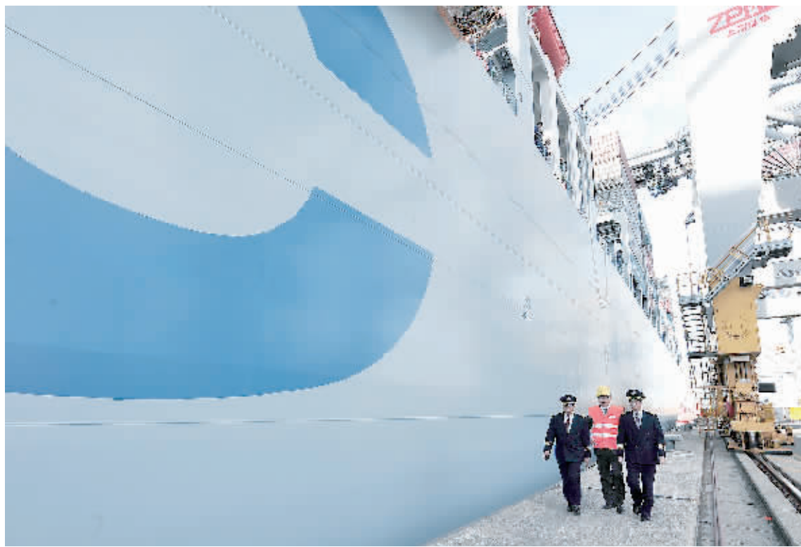
4月14日，中远集装箱运输有限公司的“比利时”号集装箱轮处女航抵达安特卫普港。“比利时”号是中国船厂自行设计建造的最大箱位集装箱轮，运载能力达到13386标准集装箱。该集装箱轮的成功建造，打破了国外船厂在超大型集装箱轮建造领域的垄断地位。