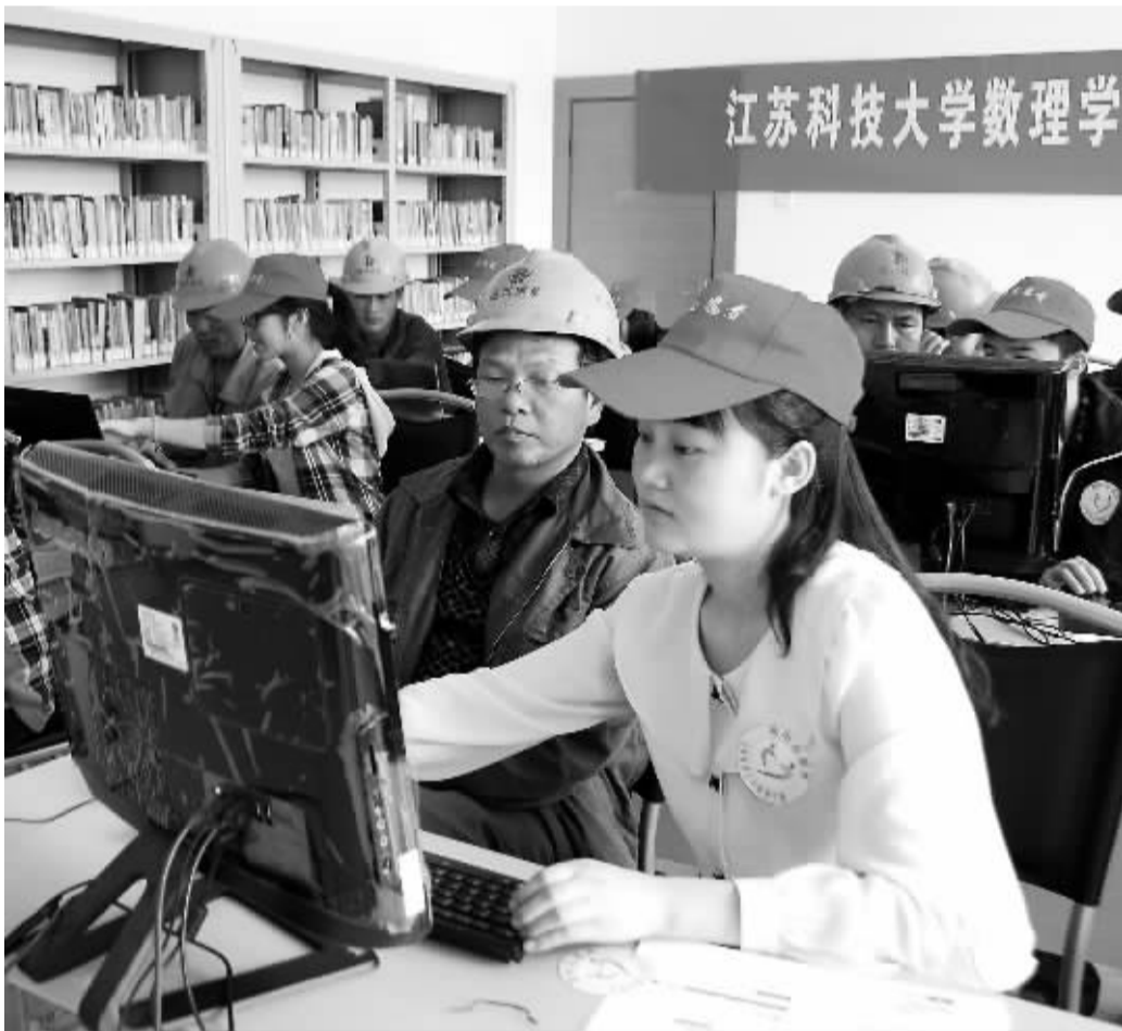
4月14日，志愿者在江苏省镇江市润州区七里向街道万科社区农民工网络学堂为农民工讲课。当日，江苏省镇江市农民工网络学堂在润州区七里向街道万科社区成立，来自江苏科技大学数学学院的大学生志愿者将定期走进学堂，为当地的外来务工人员传授网上购票、网上购物、网上读书等知识和技能。

自1985年人民法院开展专利审判工作以来，最高人民法院对专利纠纷案件一直实行相对集中的管辖措施。在我国开展专利审判初期，这些措施对于加强审判指导、统一法律适用标准、培养专业法官队伍和总结审判经验等，发挥了十分重要的作用。近年来，我国专利侵权案件数量不断增长，专利权人保护权利的司法需求日益增强。为了方便当事人诉讼，使专利案件管辖权布局更加合理，最高人民法院自2009年以来先后批准一些基层法院试点审理实用新型和外观设计专利纠纷民事案件，为基层法院审理专利民事纠纷案件积累了经验。