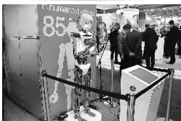
图为2013年德国汉诺威工业博览会上展出的仿真人，它讲话的音质和讲标准话的普通人没什么两样。它可以做导游或代替人演讲。