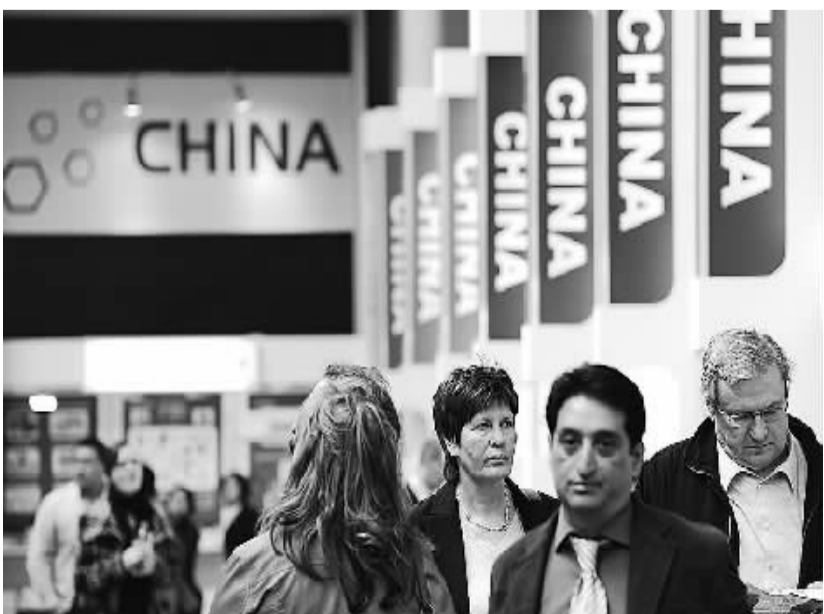
4月8日，观众在德国汉诺威工博会中国展区参观。