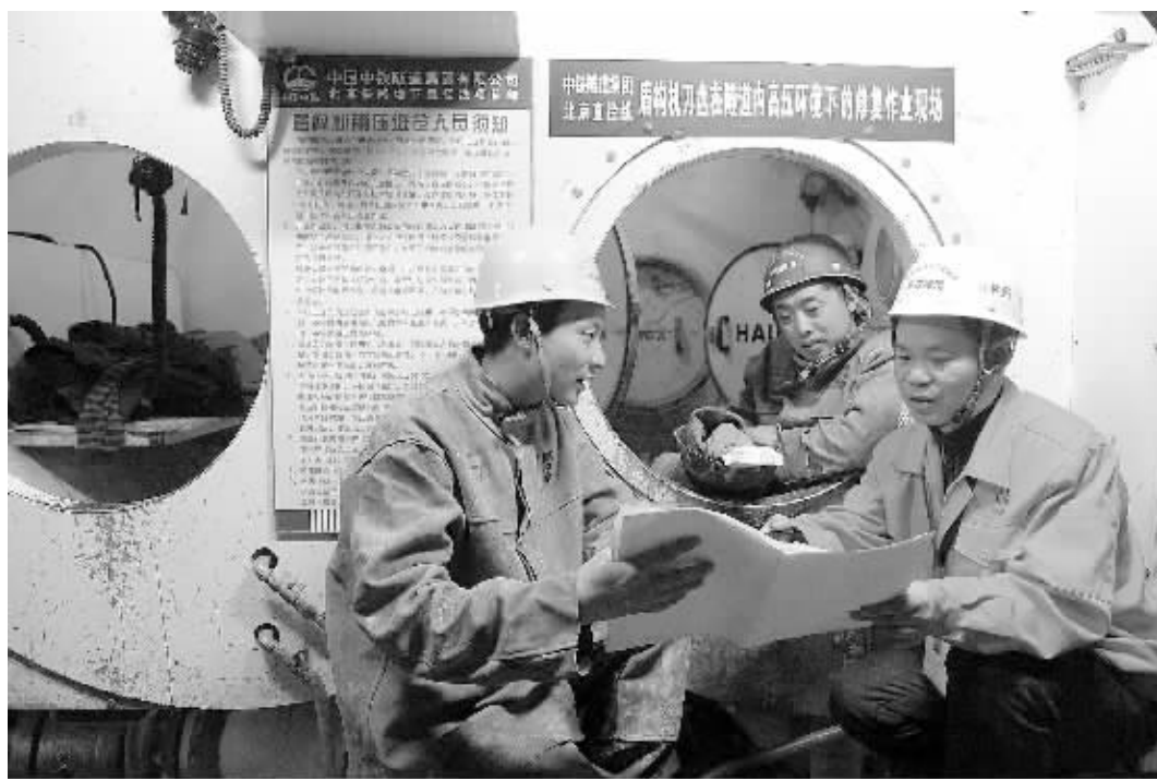
中铁隧道集团联合海军工程大学等院校专家自主研发的盾构机刀盘修复技术近日在北京铁路地下直径线工程首次成功应用。图为中铁隧道工程技术人员(右)在修复作业现场进行技术部署。

法院递交无锡尚德破产重整申请。经法院审查,鉴于无锡尚德无法归还到期债务且对债权银行提出的破产重整无异议,依据《破产法》相关规定,于3月20日正式裁定对无锡尚德实施破产重整。