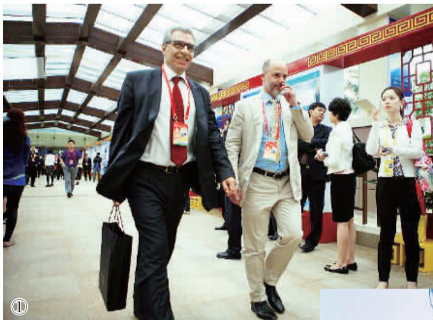
图1 外国嘉宾步入开幕式会场。