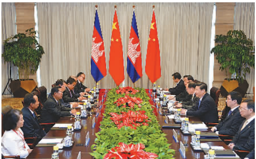
4月7日，国家主席习近平在海南省博鳌会见柬埔寨首相洪森。

新华社海南博鳌4月7日电 (记者刘华 傅勇涛) 国家主席习近平7日在海南省博鳌会见柬埔寨首相洪森。习近平指出，中柬始终真诚相待、患难与共，相互信任、相互支持，各领域合作广度和深度达到前所未有的水平。“路遥知马力，日久见人心”。中柬友谊经受了国际风云变幻的考验。两国是好邻居、好朋友、好伙伴，更是好兄弟。中柬关系是国与国友好相处、密切合作的典范。习近平强调，中方高度重视柬埔寨和中柬关系，支