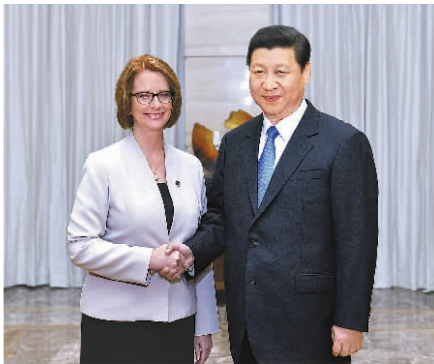
4月7日，国家主席习近平在海南省博鳌会见澳大利亚总理吉拉德。

新华社海南博鳌4月7日电 (记者刘华 王晔余) 国家主席习近平7日在海南省博鳌会见澳大利亚总理吉拉德。习近平指出，建交40年来，中澳关系全面发展，利益交融不断加深。事实证明，中澳两国完全可以成为友好相处、共同发展的伙伴。我们双方一致同意构建相互信任、互利共赢的战略伙伴关系，并建立两国总理年度