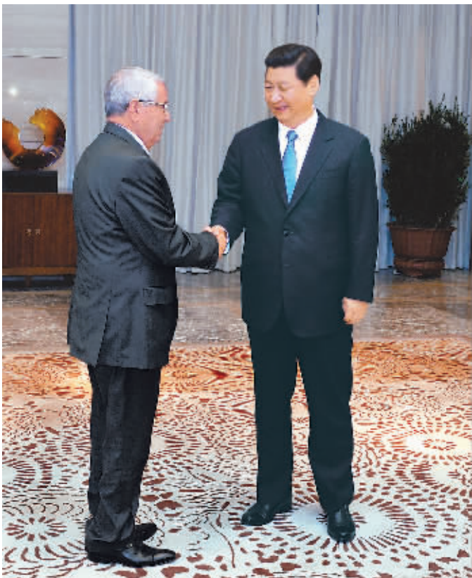
4月7日，国家主席习近平在海南省博鳌会见阿尔及利亚民族院议长本萨拉赫。

新华社海南博鳌4月7日电 (记者刘华 魏晔) 国家主席习近平7日在海南省博鳌会见阿尔及利亚民族院议长本萨拉赫。习近平表示，中阿堪称患难之交，两国人民在阿尔及利亚民族解放斗争中铸就了深厚友谊。中国人民永远不会忘记阿尔及利亚为中国恢复在联合国合法席位作出的重要贡献，感谢阿方在涉及中国核心利益和重大关切问题上给予的坚定支持。