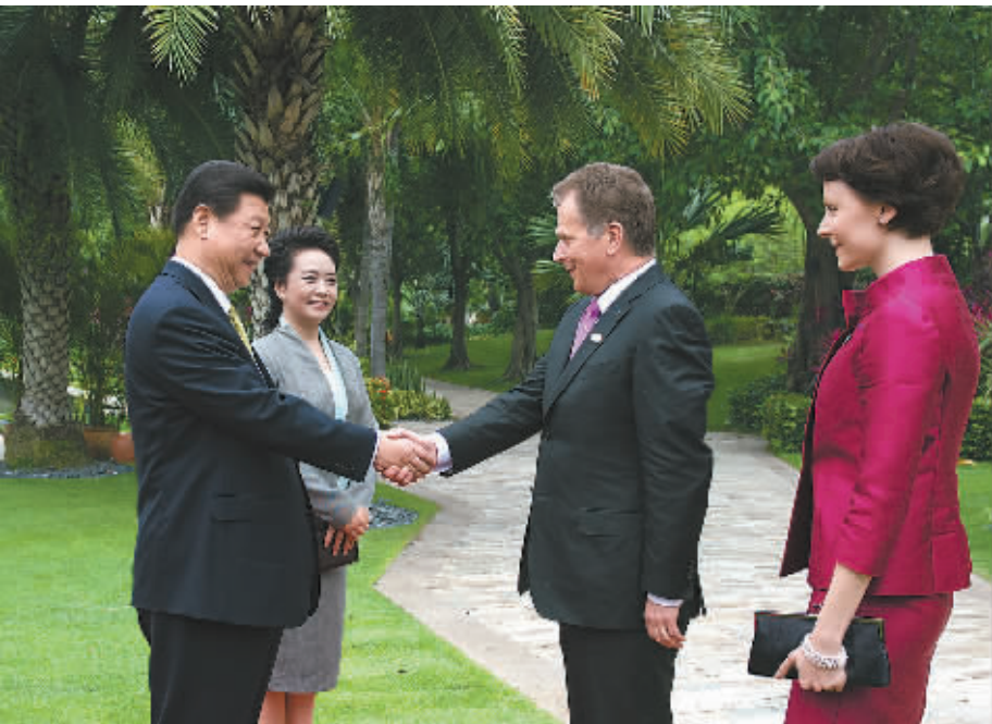
4月6日,国家主席习近平在海南省三亚市同芬兰总统尼尼斯特举行会谈。会谈前,习近平为尼尼斯特访华举行欢迎仪式。这是习近平和夫人彭丽媛迎接尼尼斯特和夫人。