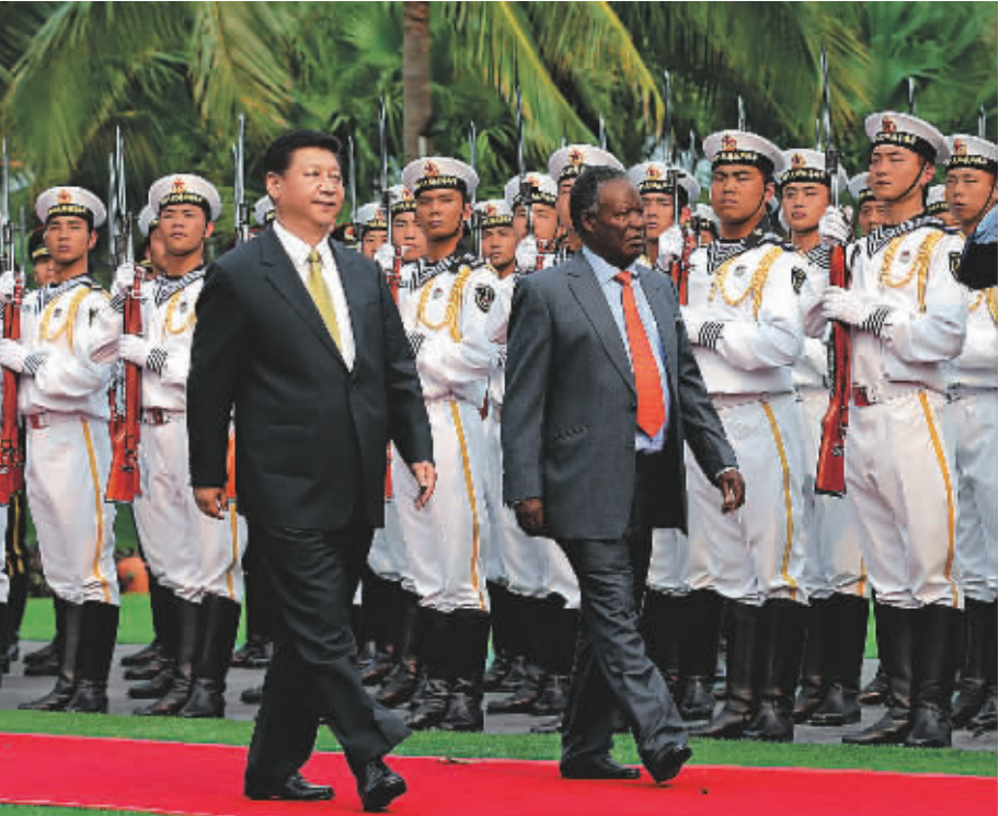
4月6日,国家主席习近平在海南省三亚市同赞比亚总统萨塔举行会谈。会谈前,习近平为萨塔访华举行欢迎仪式。