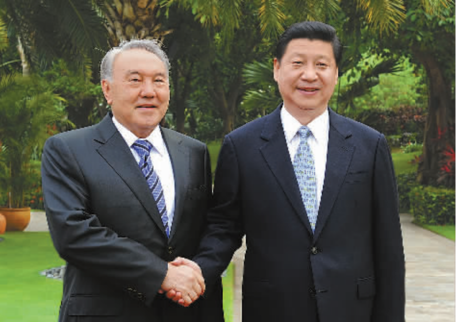
4月6日,国家主席习近平在海南省三亚市同哈萨克斯坦总统纳扎尔巴耶夫举行会谈。会谈前,习近平为纳扎尔巴耶夫访华举行欢迎仪式。