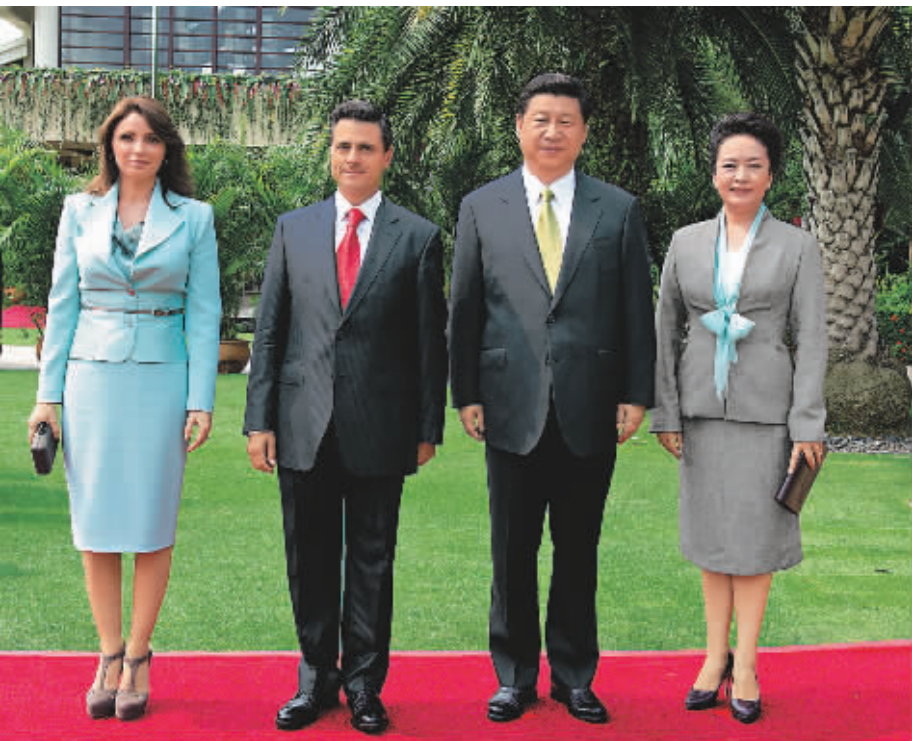
4月6日,国家主席习近平在海南省三亚市同墨西哥总统培尼亚举行会谈。会谈前,习近平为培尼亚访华举行欢迎仪式。这是习近平和夫人彭丽媛同培尼亚和夫人合影。