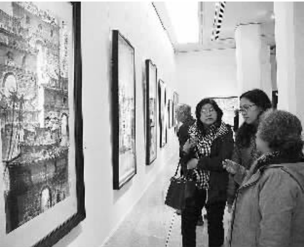
“美丽台湾”——台湾近现代名家经典作品展（1911—2011）4月2日上午在北京中国美术馆开幕。本次展览集中展示了台湾140余位画家的近170幅作品，反映出近百年台湾美术创作的深厚底蕴和勃勃生机，也为大陆民众了解台湾打开了一扇窗户。

由于该公司通过克隆技术培育的蝴蝶兰具有花色鲜艳、花期长、适应气候能力强的特点，很快得到了国内外客商的青睐。目前，在漳浦较大型蝴蝶兰培育企业有14家，年产蝴蝶兰苗近5000万株，总产值超过2亿元。为进一步做大做强蝴蝶兰产业，漳浦县正在建设一个占地5000亩的兰花产业园，总投资18亿元。该园区将引导掌握蝴蝶兰生产技术的台湾农业企业、研究机构和高素质的蝴蝶兰专业农民入园创业，实现与台湾蝴蝶兰产业的深度对接。