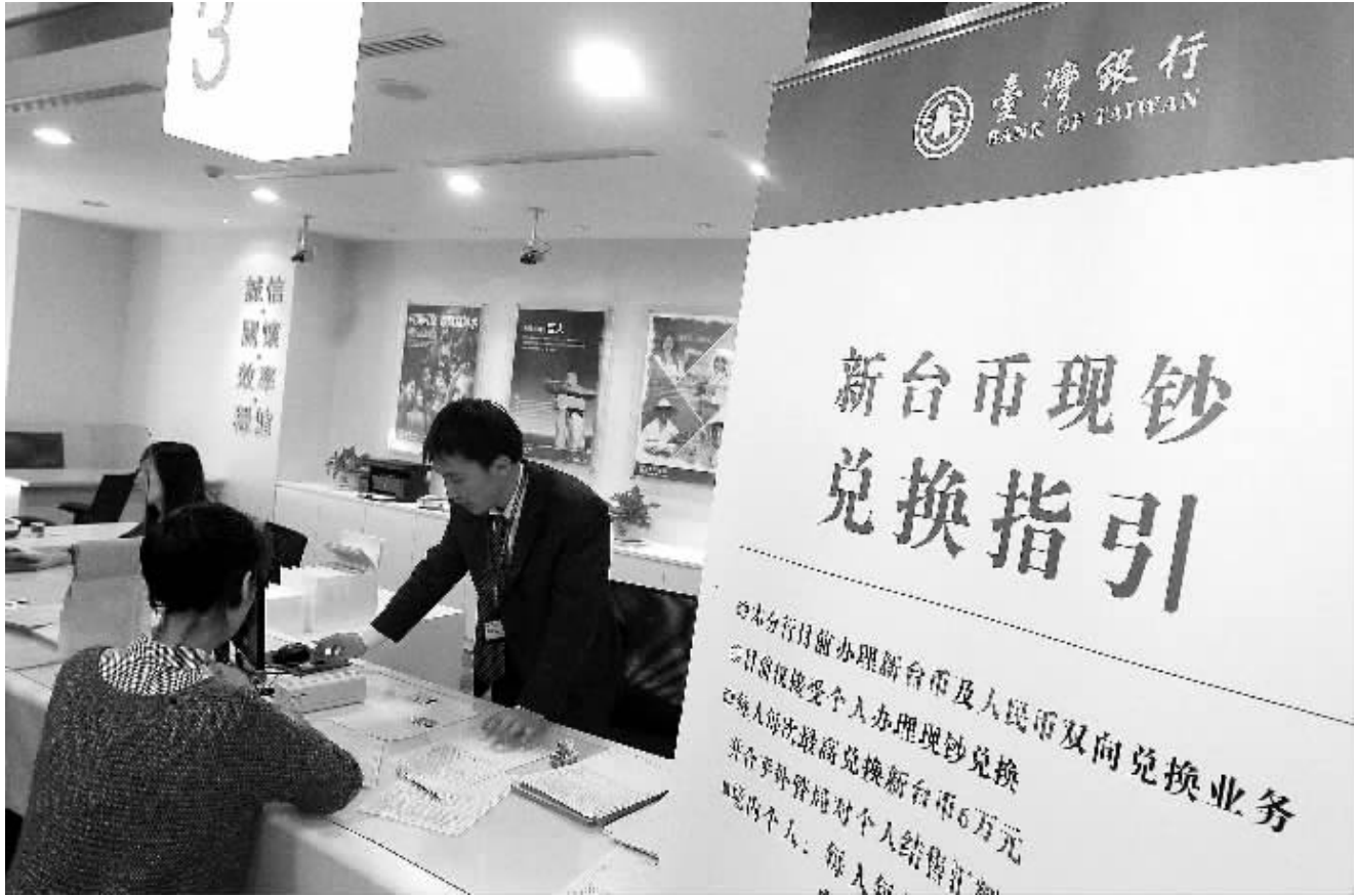
4月2日，客户在台湾银行上海分行柜台兑换新台币。当日，两岸货币清算机制启动后，首批无需经第三地银行而直接“登陆”的新台币在台湾银行上海分行柜台正式开启现钞兑换。两岸金融界人士表示，这将进一步方便两岸人员往来，特别是满足大陆人士赴台旅游、探亲及求学等的新台币现钞兑换需求。

数量申请和高科技产业出口占比都有明显提升。但与以色列、新加坡等相比，香港的高等教育入学率和公共教育支出占财政收入比重依然相对偏低，因此香港在人力资本与创新能力方面仍有较大的提升空间。 报告认为，香港的经济整体向好，保持健康运行。政府债务占GDP比重保持在相对较低的水平，通货膨胀也趋稳回落。整体经济实力方面，除保持显著的增长外，经济表现也带动了多个行业的职位