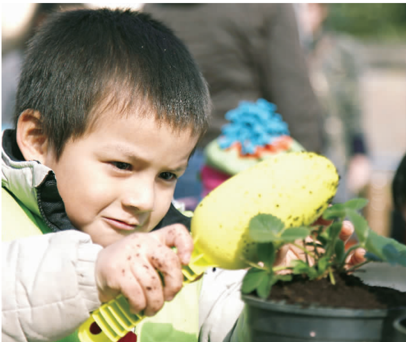
3月27日,在比利时首都布鲁塞尔一家社区活动中心,一名小男孩给植物培土。随着初春踌躇而至,这家社区活动中心当日邀请青少年体验在“播种的季节”时种下各类植物,培养热爱生活的情操,也锻炼了动手能力。布鲁塞尔其他教育机构当日也组织了各种户外活动,让孩子们享受春日阳光。