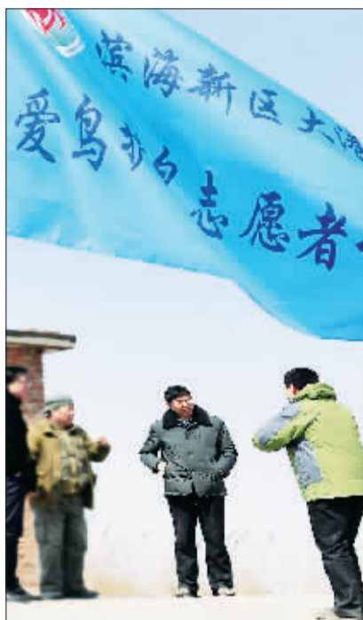
大港组建了多个爱鸟护鸟志愿者协会,为鸟类迁徙护航。

有大港各级领导的高度重视,有大港众多护鸟志愿者及野生动物保护站工作人员的悉心巡护,今年初春,东亚至澳大利亚候鸟迁徙的必经之地——美丽的大港湿地自然保护区迎来了近万只东方白鹳、白天鹅、丹顶鹤、苍鹭、大鸨、灰鹤等珍稀候鸟,这里成了百鸟栖息的乐园。