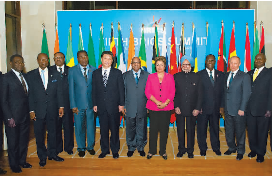
领导人三 国 这是上新华社记 黄敬文 摄。

习近平指出,金砖国家同非洲国家有广泛共同利益,是志同道合的朋友。非洲崛起对金砖国家是机遇,金砖国家发展对非洲也是机遇。 (下转第四版)