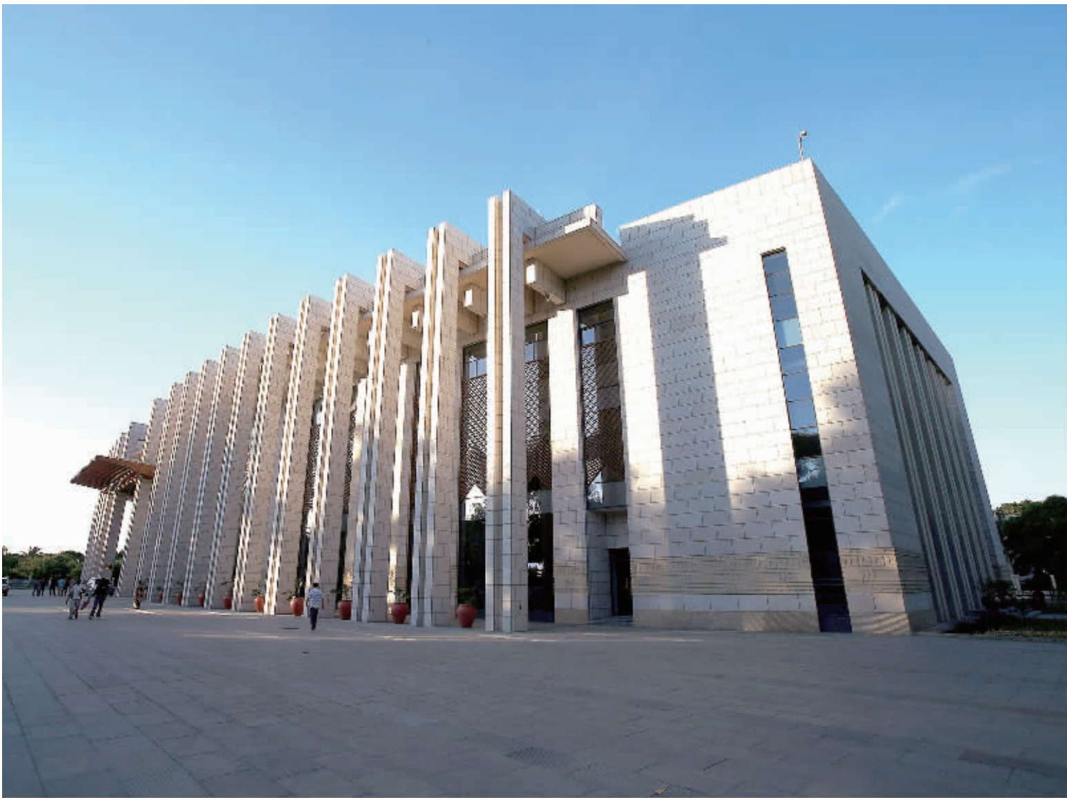
这是3月21日拍摄的坦桑尼亚达累斯萨拉姆市尼雷尔国际会议中心外景。

位于坦桑尼亚达累斯萨拉姆市依拉拉区的尼雷尔国际会议中心为中国政府援建项目。该项目于2010年3月正式开工,2012年9月全部竣工,总用地面积2.5219公顷,总建筑面积11593平方米,建有大、中、小会议厅、多功能厅、门厅、会议室、新闻发布室、媒体用房、贵宾休息厅、雇员餐厅等设施。