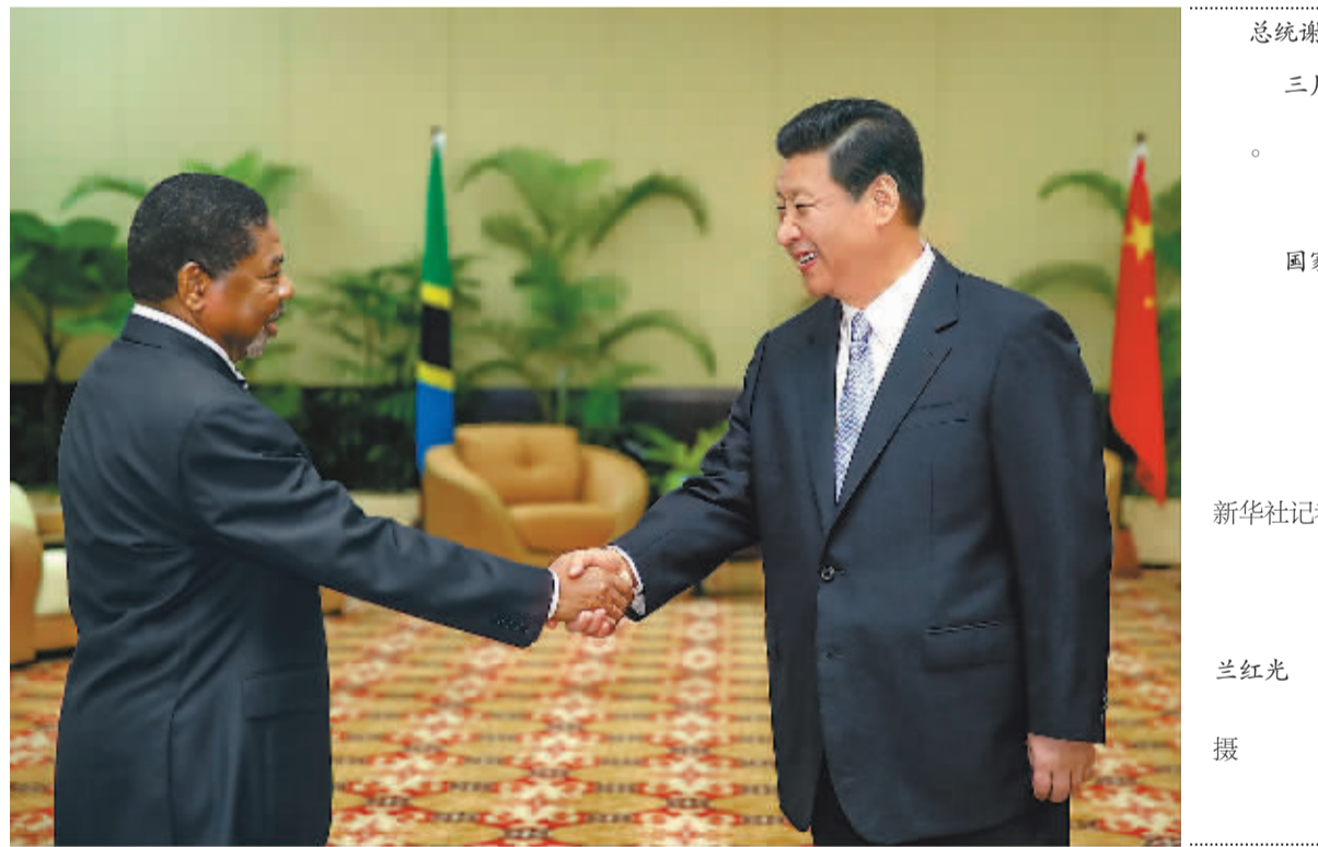
总统谢因 三月二 。国家主