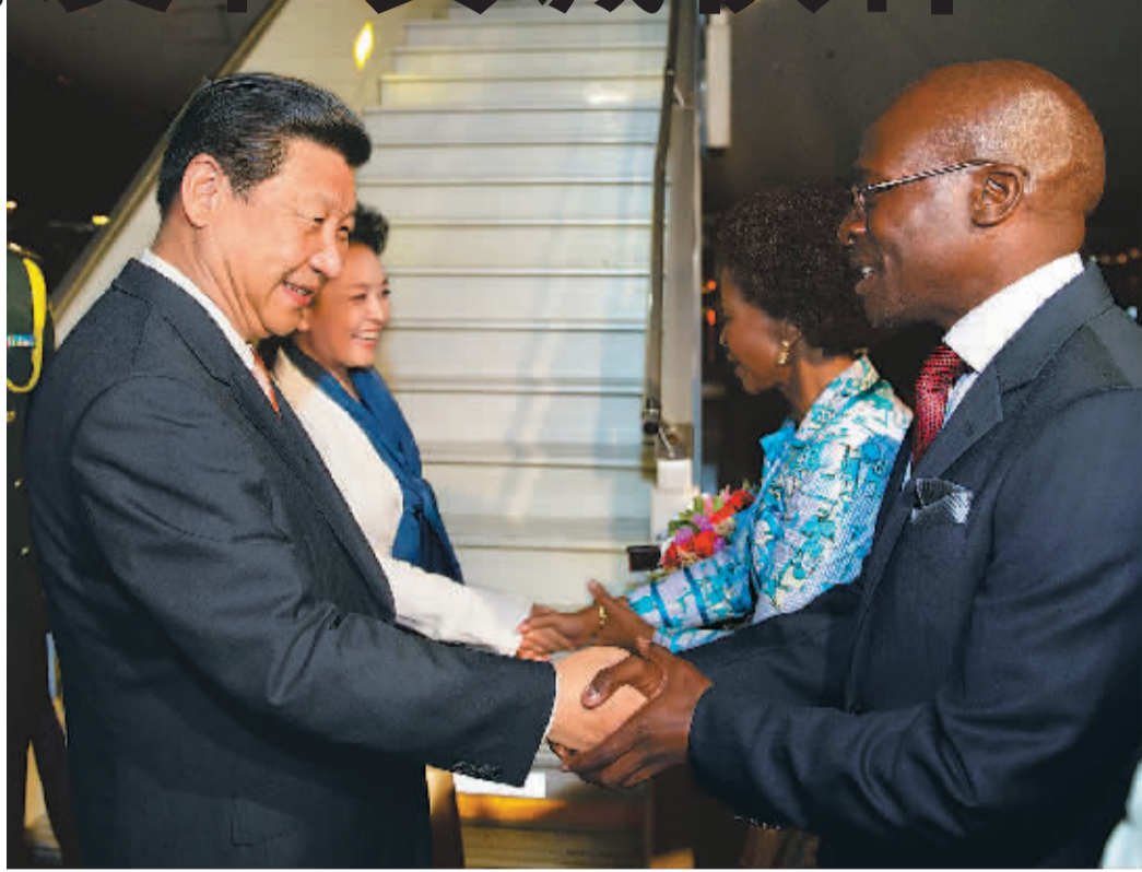
3月25日, 国家主席习近平抵达南非比勒陀利亚, 开始对南非进行国事访问。这是习近平和夫人彭丽媛在机场受到南非国际关系与合作部长马沙巴内和国有企业部长吉加巴等热情迎接。