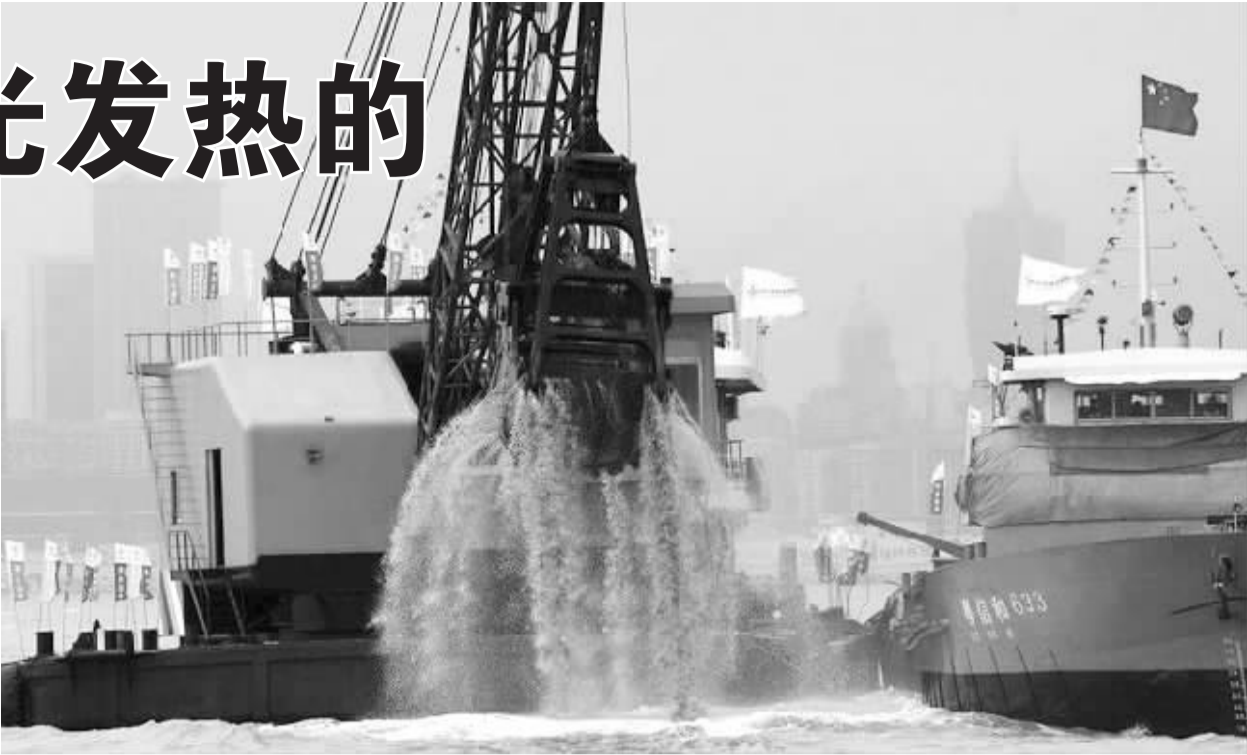
经过多年发展，珠光集团如今的资产总值达数十亿元，在供砂、填海等多个领域发挥着举足轻重的作用。

说起珠光集团，现在的大多数人恐怕都不清楚它是做什么的，但在十几年前的港澳及珠三角地区，珠光集团的名气可不小。