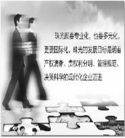
珠光既要专业化，也要多元化，更要国际化，珠光的发展目标是朝着产权清晰、责权利分明、管理规范、决策科学的现代化企业迈进