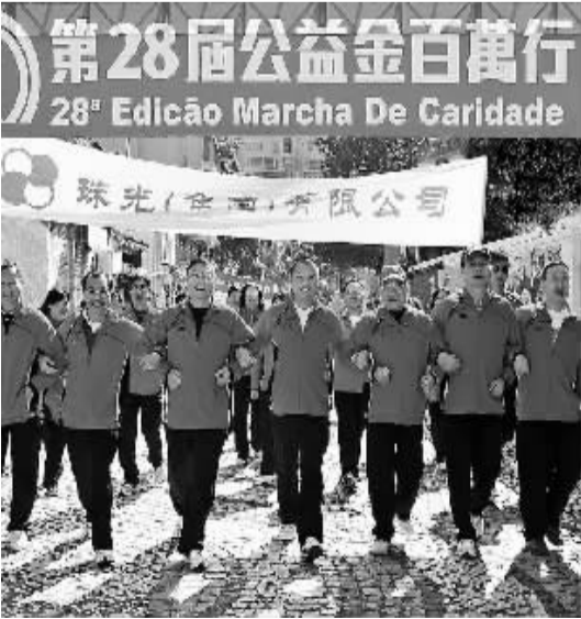
珠光集团员工参加第28届澳门公益金百万行活动。

通过珠光集团在企业文化建设方方面面的剪影，我们不难看出，开拓进取、坚忍不拔的珠光精神在发扬光大；团结一致、奋发向上、心系企业、奉献社会的珠光文化，已融入团队，不断升华。珠光集团正迈开坚实的步伐，建设一流企业，创造美好生活，走向光辉未来。