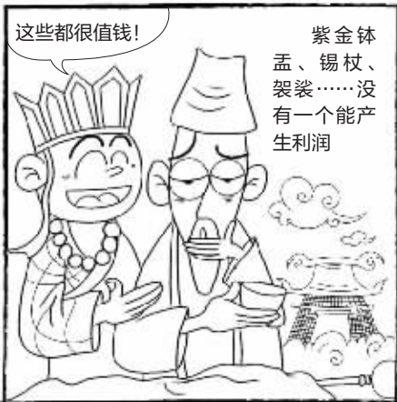
天宮会计师事务所盘点资产