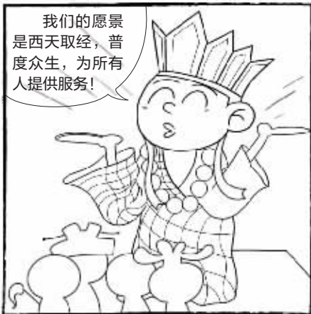
唐僧股份有限公司登陆神斯达克路演