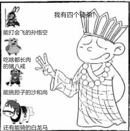
会计师疑问：去西天取经，路途遥远，你连个车都没有，怎么去？