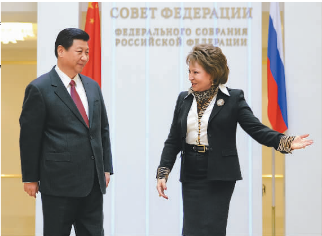
马特维延科 三月二十三日 。国家主席习近平在莫斯科会见了俄罗斯联邦委员会主席马特维延科。

纳雷什金表示，俄中对国际秩序等许多重大问题看法一致，俄方高度重视两国全面战略协作伙伴关系。习近平主席这次访问成果丰硕，两国元首达成了多项合作协议，使两国关系基础更加牢固。俄罗斯国家杜马各党派在发展俄中关系方面高度一致，坚定支持两国合作，希望继续加强两国立法机构和政党之间友好交往。 王沪宁、栗战书、杨洁篪等参加会见。