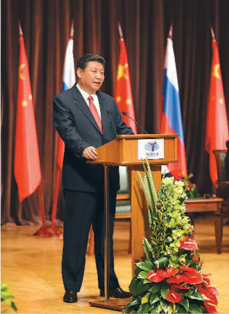
3月23日,国家主席习近平在莫斯科国际关系学院发表演讲。

本报莫斯科3月23日电 记者廖伟径报道:正在俄罗斯进行国事访问的国家主席习近平23日在莫斯科国际关系学院发表题为《顺应时代前进潮流 促进世界和平发展》的重要演讲。习近平在演讲中深入阐述中国对当前世界形势的看法和对国际关系的立场主张,呼吁各国共同推动建立以合作共赢为核心的新型国际关系,强调中国坚定不移走和平发展道路,坚定不移发展中俄全面战略协作伙伴关系。 上午11时许,莫斯科国际关系学院会议厅座无虚席,过道及后方都站满了老师和学生。习近平在俄罗斯联邦副总理戈洛杰茨、莫斯科国际关系学院院长托尔库诺夫陪同下步入会议厅,全场起立欢迎。 戈洛杰茨致欢迎辞。托尔库诺夫邀请习近平发表演讲。 习近平表示,俄罗斯是中国的友好邻邦。一年之计在于春。中俄双方把握这美好的早春时节,为两国关系和世界和平与发展辛勤耕耘,必将收获新的成果,造福两国人民和各国人民。 习近平指出,我们所处的是一个风云变幻的时代,面对的是一个日新月异的世界。当今世界,和平、发展、合作、共赢成为时代潮流,一大批新兴市场国家和发展中国家走上发展的快车道,各国相互联系、相互依存的程度空前加深,人类依然面临诸多难题和挑战。我们希望世界变得更加美好,我们也有理由相信,世界会变得更加美好。同时,我们也清楚地知道,前途是光明的,道路是曲折的。 习近平强调,世界潮流,浩浩荡荡,顺之则昌,逆之则亡。要跟上时代前进步伐,就不能身体已进入21世纪,而脑袋还停留在过去,停留在殖民扩张的旧