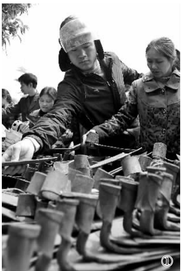
图① 3月19日,在广西桂林市灌阳县滨江路,当地农民在选购铁具。

国家将加大对专业大户、家庭农场和农民专业合作社等新型农业经营主体的支持力度,实行新增补贴向专业大户、家庭农场和农民专业合作社倾斜政策。鼓励和支持承包土地向专业大户、家庭农场、农民合作社流转,发展多种形式的适度规模经营。鼓励有条件的地方建立家庭农场登记制度,明确认定标准、登记办法、扶持政策。探索开展家庭农场统计和家庭农场经营者培训工作。推动相关部门采取奖励补助等多种办法,扶持家庭农场健康发展。