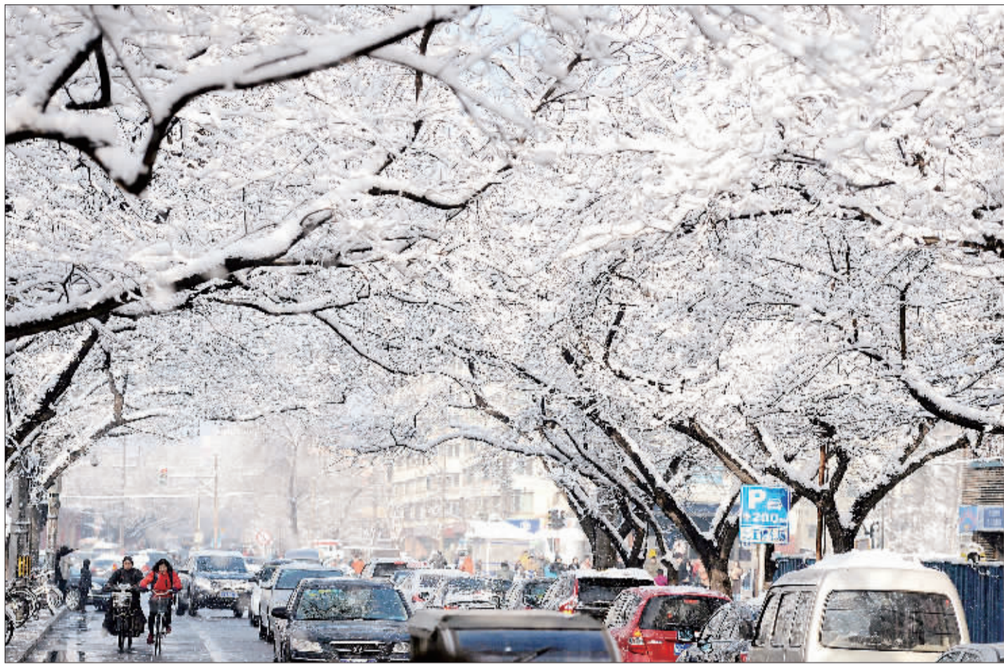
3月20日，北京普降春雪，虽然积雪厚度超过10厘米，但道路通行良好，降雪对冬小麦返青、缓解空气污染作用明显。