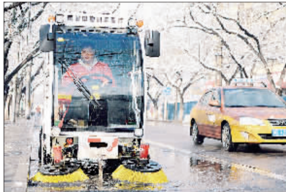
北京市环卫专业作业单位出动15000余人次，在全市道路开展除雪及清扫作业。