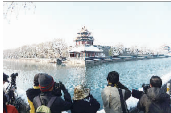
雪后银装的故宫角楼，吸引了众多摄影爱好者前来拍摄。