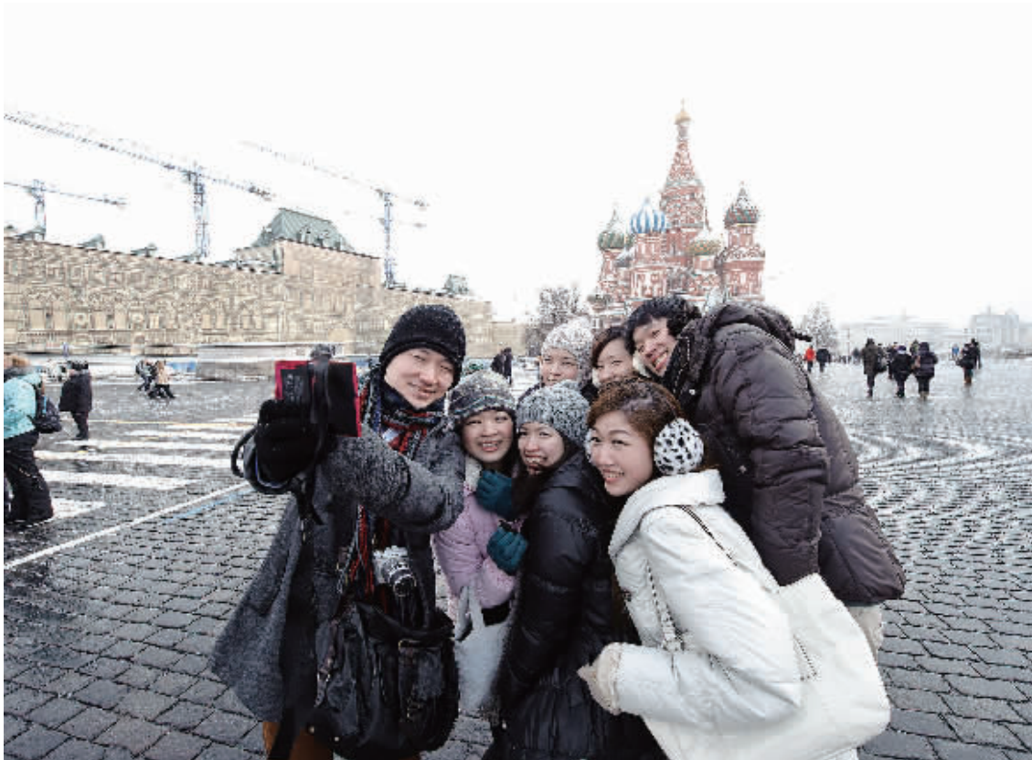
中俄两国山水相连，民间旅游的日益活跃促进了两国人民的相近和相知。这是2013年3月2日，来自中国香港的大学生游客在俄罗斯莫斯科红场拍照留念。

东盟战略项目包括与东盟国家合作发展文化产业，运用地缘文化纽带加强东盟国家间的关系与合作；重视提升边境文化交流窗口作用，大力发展与缅甸、老挝、柬埔寨等邻国边境地区的文化交流合作，进而促进边境地区的经济发展，提高双方民的生活水平。