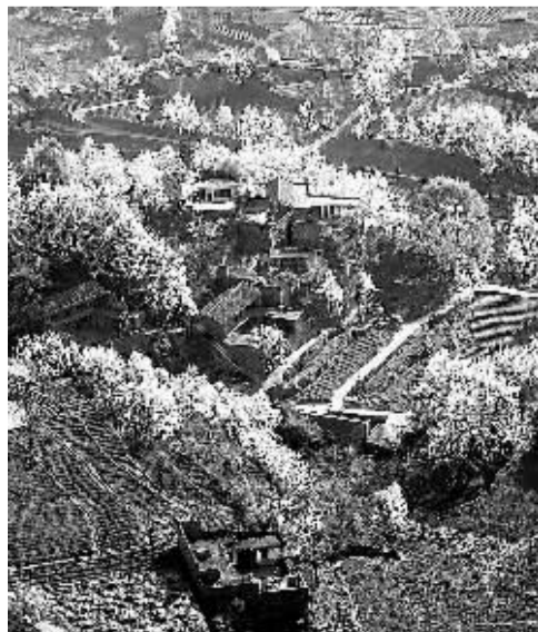
阳春三月，四川省金川县的万亩梨花齐放，漫山遍野一片洁白。美丽的田园风光吸引了众多游客。新华社记者 江宏景摄

保胜公司的分布式光伏发电项目为国家金太阳示范项目，接入系统方式为低压侧“并网不上网”方式，发电量消纳方式为全部自发自用。2560块光伏板安装在该公司厂房屋顶，组装建设1套光伏发电系统，装机容量为600千瓦。按照设计构想，年均发电量可达66.42万千瓦时。