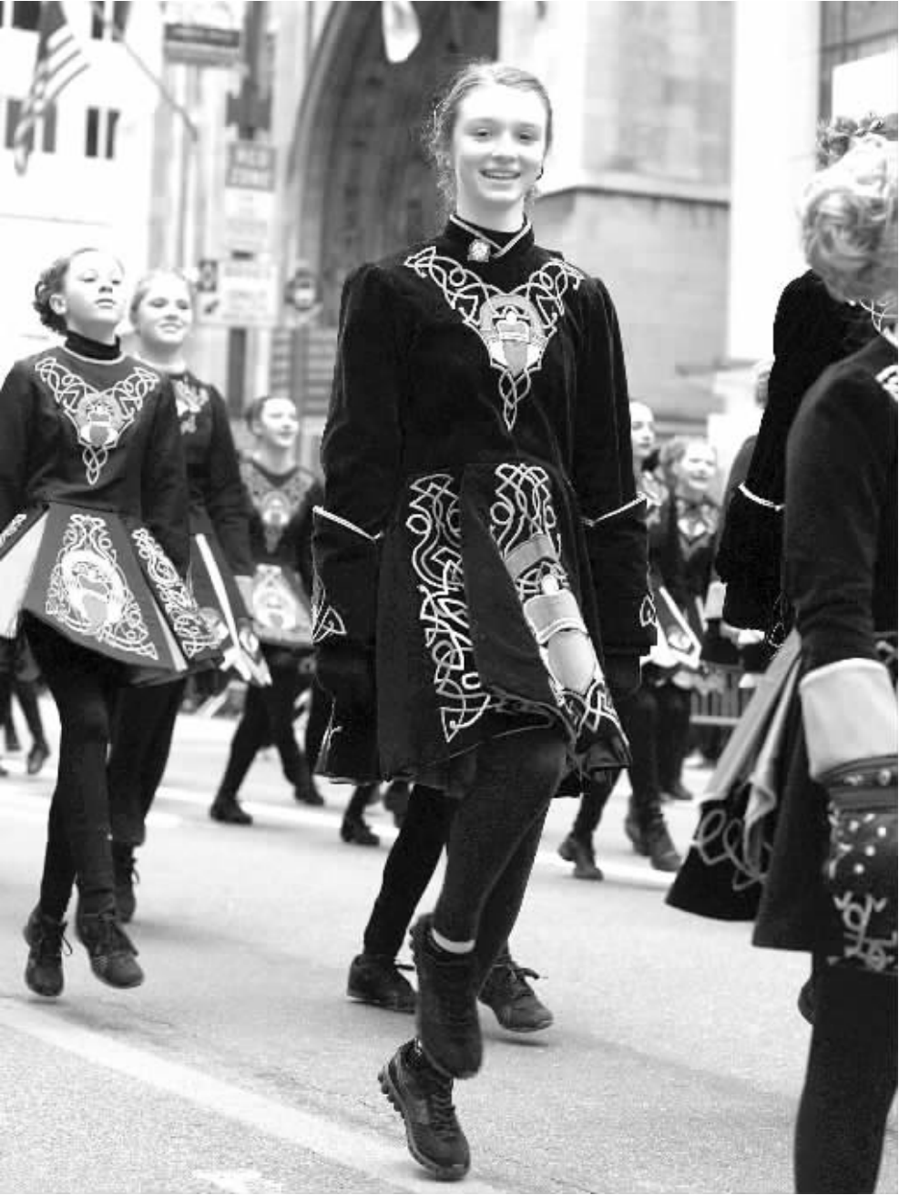
3月16日,游行队伍中的表演者踏着鼓点一边跳舞一边经过美国纽约曼哈顿第五大道。当天,美国纽约举行第252届圣帕特里克节盛大游行,吸引了成千上万的当地民众和来自世界各地的游客前来观看。

本报新加坡电 记者陶杰报道:新加坡副总理兼财政部长尚达曼日前在第52届ACI国际金融市场协会全球大会上表示,新加坡作为全球国际贸易与金融中心之一,积极支持人民币离岸市场在亚洲区域的发展,并愿意作为人民币新产品的试点,以协助提高人民币在亚洲区域的流通性,方便企业与投资者筹集人民币资金,以及支持离岸人民币与亚洲货币市场的结合。尚达曼表示,在推动岸外人民币发展过程中,各地监管者和市场参与者应该通力合作,以发展一个单一可互换的离岸人民币市场,这样既可以避免离岸人民币的流通性被分散,同时也能够促进和提高离岸人民币市场的效率。尚达曼认为,推出更多的人民币产品是一个良好的开端,可以让企业和投资者有更多的选择,让他们有更多的产品可以投资。 尚达曼认为,人民币将逐步在全球和区域金融市场扮演更大的角色,这一点是毋庸置疑的。随着离岸人民币在多个市场的发展,促进一个单一可互换的离岸人民币市场发展至关重要,因为这可以使不同地方的离岸人民币互换代替。他呼吁各地金融管制者和市场参与者之间携手合作,提高离岸人民币市场的效率。