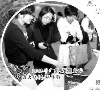
2013年广州、深圳启动最大规模4G体验

近期，广东移动推出“心服务，新价值”五心服务承诺，通过“全网络真心服务”、“全渠道温心服务”、“全互联精心服务”、“全业务贴心服务”、“全过程放心服务”以及涵盖了网络、移动互联、资费、便民、安全等领域的十大新服务举措，全方位完善服务手段，不断优化服务品质，造福社会民生。2013年，广东移动将全面唱响“心服务，新价值”服务主题，致力于为用户提供便利、实惠的服务，助力广东实现“三个定位、两个率先”。