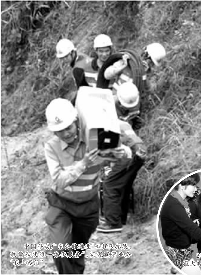
中国移动广东公司通过“工程队拓展、收费和装维一体化服务”，实现宽带业务“线上客门”