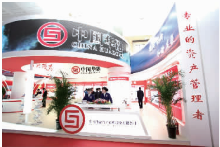
中国华融资产管理股份有限公司参加第八届北京国际金融博览会

今天，我国金融资产管理公司需要大胆解放思想、深化改革、开阔视野，在管理部门支持下积极拓展业务领域，把公司业务由传统的金融不良资产向非金融不良资产延伸，由传统的不良资产处置向对公、对高端私人客户的典型意义上的各类资产管理延伸，把资产管理公司“办成真正的资产管理公司”。我国金融资产管理公司要想在综合经营的道路上走得更好、更远、更稳，必