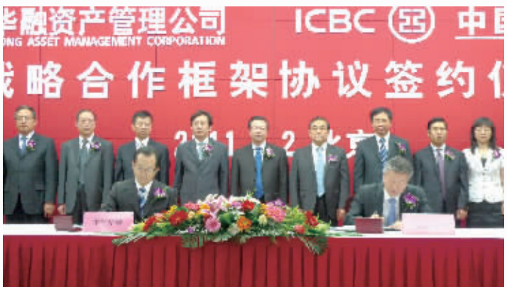
中国华融与工商银行双方代表签署战略合作协议

一，速度与质量的关系。又好又稳，“好”是质量、是内涵，“稳”是速度、是节奏，要强调经营管理的科学化、规范化